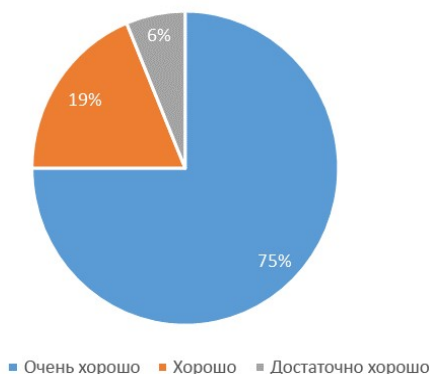
Оценка содержания совещания